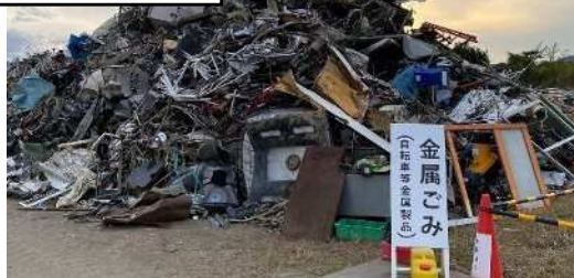
仮置場への 持ち込み