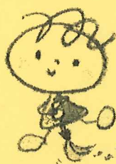
ごみ減量啓発キャラクター しずもちゃん