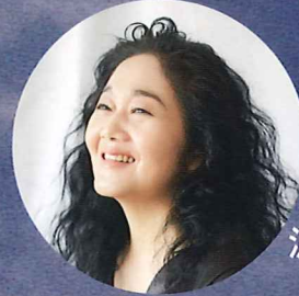
波多野睦美(メゾソプラノ)